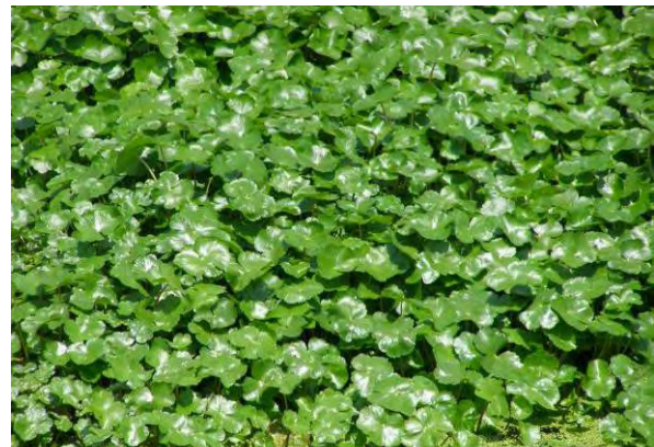
ブラジルチドメグサ