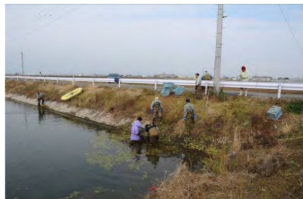
ブラジルチドメグサ 防除の試行