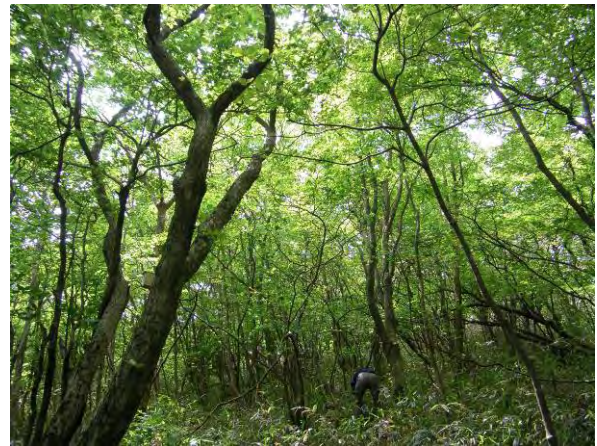
酸性雨等森林生態系影響調査 調査地点（脊振山）

環境啓発活動の一環として、平成 22 年度は計 44 回の講師派遣を行った。内容別では、ふくおか県政出前講座に 3 回、保健福祉環境事務所が実施する水辺教室に 14 回及び生物多様性関連事業に 10 回、県環境部環境保全課が実施する水生生物講座、県教育センターが実施するキャリアアップ講座、那珂県土整備事務所が実施するワークショップに各 1 回、市町村が実施する自然観察会等に 4 回、財団その他等が実施する自然観察会等に 10 回派遣を行った。