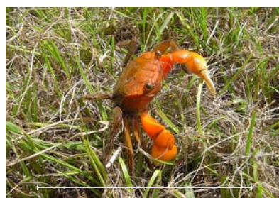
ベンケイガニ 赤い色が鮮やかなカニです。よく似た色をしたアカテガニとは側縁に切れ込みがあることで区別されます。