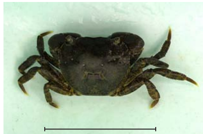
ケフサイソガニ 河口部でよく見かけるカニで、はさみに泥がついているように見える房状の毛があり、腹部に黒い斑紋があります。