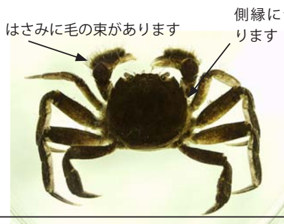
モクズガニ 川の上中流部でも見つかります

河口部にはアシハラガニやベンケイガニ類など様々なイワガニ科の種類が生息しています。淡水域で見つかるイワガニ科の種類としてモクズガニが知られており、繁殖は河口付近で行い子ガニは川を上っていきます。淡水域で見つかった場合も、モクズガニはサワガニと比べるとより大型で、はさみに毛の束があること、体の側縁に切れ込みがあること等で容易に区別可能です。モクズガニは食用にもされ、福岡県下ではツガニの名称でよく売られています。