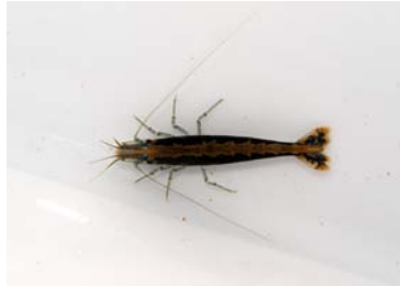
色が濃く背中のすじが明瞭な個体