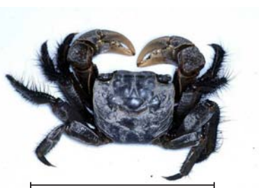
クロベンケイガニ 泥質の河口部で見かける比較的大型のカニです。