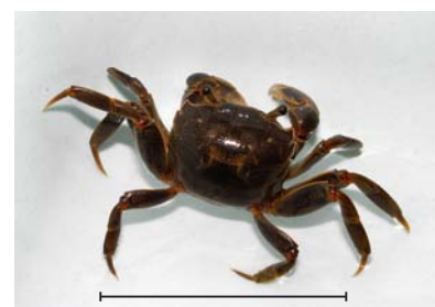
アシハラガニ 名前のとおり河口付近のアシ原の中でよく見つかります。