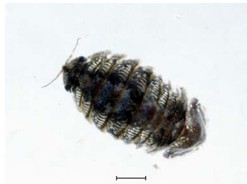
イソコツブムシ属の一種

河口近くの塩水の影響がある場所で見られます。本科はミズムシ科と違って水中を泳ぐことが得意で、ダンゴムシのように体を丸くすることができます。