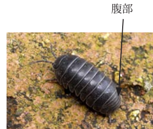
陸上で見つかるオカダンゴムシ

陸生のワラジムシやダンゴムシと間違いやすいのですが、ミズムシは腹部が節に分かれず融合して1つになっていることで区別されます。また、ダンゴムシのように体を丸くすることはありません。ミズムシは、泳ぎは得意でなく、水中の落ち葉や石の上を歩き回っています。