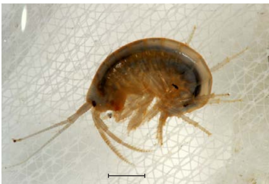
ニッポンヨコエビ

名前のお通り横向きになって移動する、小型の甲殻類です。きれいな河川で落ち葉がたまった場所等に生息しています。近年外来種のフロリダマミズヨコエビ (マミズヨコエビ科) が日本各地で確認されており、この種は多少汚れた河川でも見つかっています。