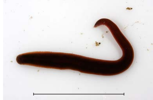
イシビル科の一種